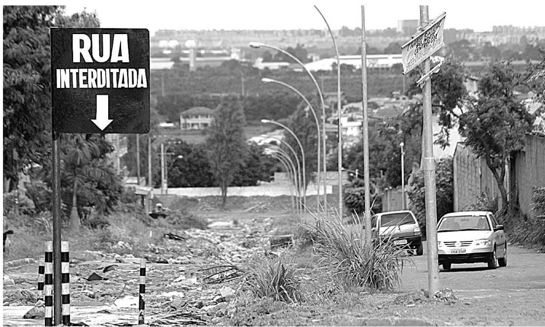
DEFESA CIVIL INTERDITOU A VIA HÁ CERCA DE DOIS MESES, MAS AINDA HÁ TRÁFEGO DE VEÍCULOS